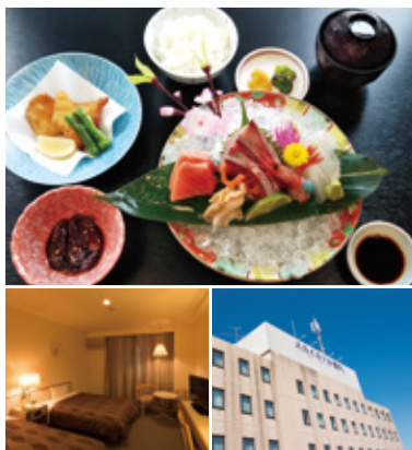
上／御造り御膳(¥2200税込) 左／客室(2名様) 右／滑川駅から徒歩1分の立地