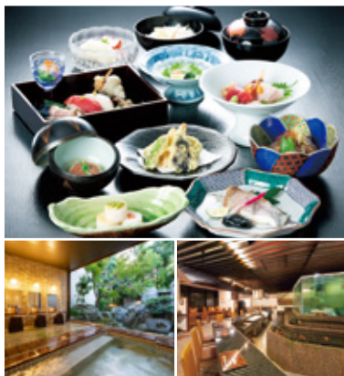
上／一泊二食付きのご夕食の一例 左下／大浴場 右下／海遊亭レストランの店内