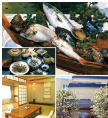
上／新鮮な魚介類を中心とした料理の一例 左／客室(2名様) 右／昭和27年創業の老舗旅館