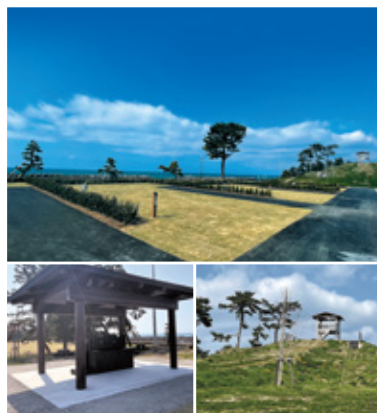
上／全4区画の広々としたオートキャンプ場 左下／手洗スペース 右下／絶景を眺められる展望台