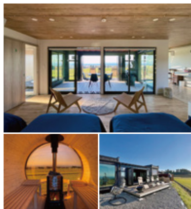
上／開放感溢れる貸切型の客室 左／パレルサウナ 右／全4棟のグランピングヴィラ